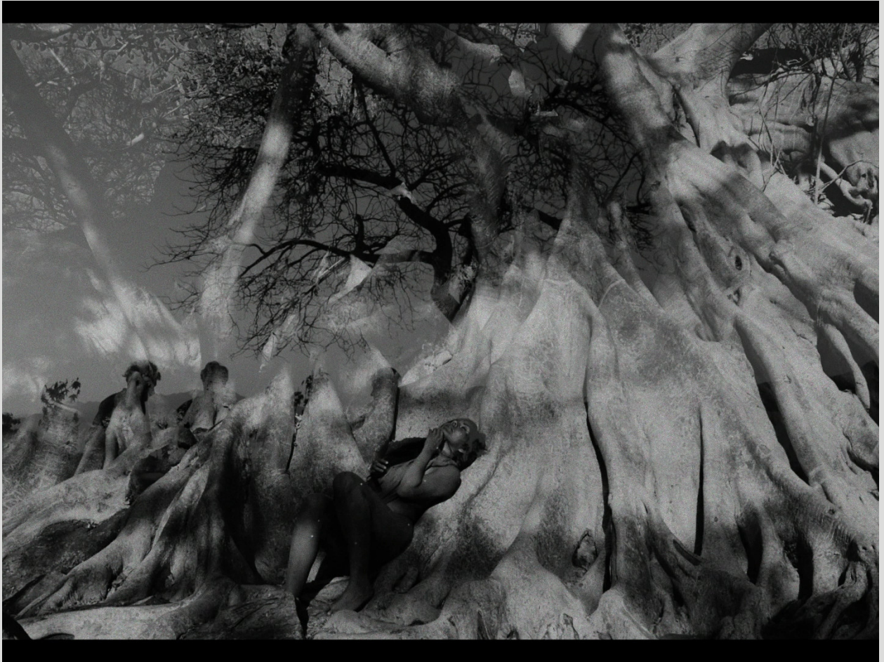
Chicueyicuicatl / Ocho canciones en Náhuatl Gabriel Pareyon (México-2021) 55 min.